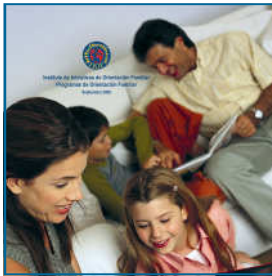
Carátula del CD con los nuevos cursos

A partir de octubre, los centros de orientación familiar dispondrán de un cd que recoge los programas de los diferentes cursos de orientación familiar con importantes novedades tanto en su formato como en los contenidos. Resultado del trabajo realizado por el Comité Técnico desde febrero de 2008, y de la colaboración de numerosas personas de los distintos COF, ya podemos ofrecer una versión más actualizada de nuestros cursos.